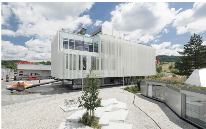
Obr. 3: Modulárna administratívna budova

Na tieto výzvy reflektujú aj normy a výskum z oblasti navrhovania nosných konštrukcií. V súčasnosti prebieha v odborných kruhoch aktualizácia platných noriem STN EN, ktoré majú byť nahradené ich druhou generáciou. Nové Eurokódy sú navrhnuté tak, aby boli ľahšie použiteľné pre každodenné výpočty a prax. Zlepšuje sa harmonizácia medzi jednotlivými normami, čo uľahčuje ich aplikáciu. Druhá generácia Eurokódov zahŕňa nové požiadavky na posudzovanie, opätovné využitie a rekonštrukciu existujúcich stavieb. To je dôležité pre udržateľnosť a predĺženie životnosti stavieb. Nové normy posilňujú požiadavky na robustnosť konštrukcií, čo zvyšuje ich odolnosť voči rôznym typom zaťaženiu a extrémnym podmienkam. Druhá generácia Eurokódov zahŕňa aj nové materiály a technológie, ako sú vláknové polymérové kompozity (FRP) a napnuté membránové konštrukcie. Tieto inovácie umožňujú širšie využitie moderných materiálov v stavebníctve.