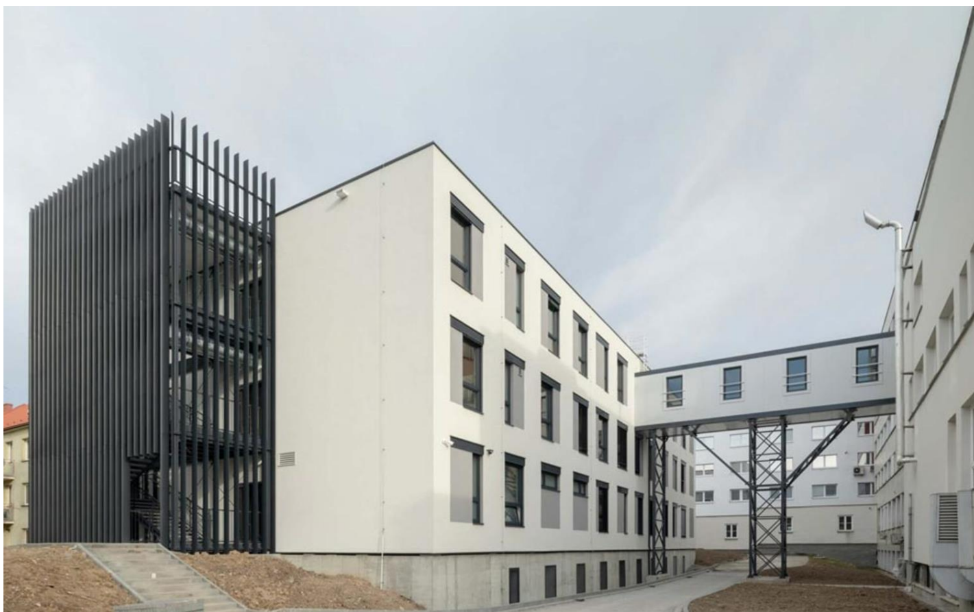
Obr. 4: Modulárna prístavba Karvína

Recyklácia a znovupoužívanie oceľových nosných prvkov predstavuje významný krok smerom k udržateľnému stavebníctvu. Oceľ je jedným z najviac recyklovateľných materiálov na svete, pričom jej recyklácia šetrí energiu a znižuje emisie CO 2 . V stavebníctve sa čoraz viac využívajú technológie a postupy, ktoré umožňujú demontáž a opätovné použitie oceľových prvkov z existujúcich stavieb. Tento prístup nielenže minimalizuje odpad, ale tiež znižuje potrebu ťažby nových surovín, čím prispieva k ochrane životného prostredia. Výzvou však zostáva zabezpečiť, aby recyklované oceľové prvky spĺňali všetky bezpečnostné a kvalitatívne normy, čo vyžaduje dôkladné testovanie a certifikáciu. Aj riešenie tohto problému je jednou z hlavných tém vedeckých kapacít a výrobného priemyslu z odvetvia oceľových konštrukcií.