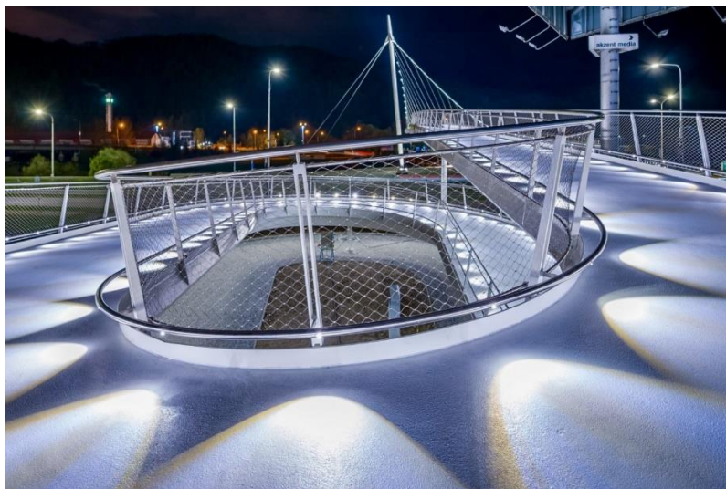
Obr. 2: Cyklomost v Banskej Bystrici