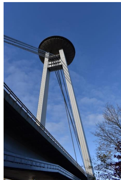
Obr. 1: Most SNP v Bratislave

V súčasnosti sa okrem niektorých väčších oceľových mostov (napr. Most Monoštor v Komárne) realizujú najmä menšie oceľové, príp. spriahnuté mostné stavby – najmä cyklolávky a lávky pre peších.